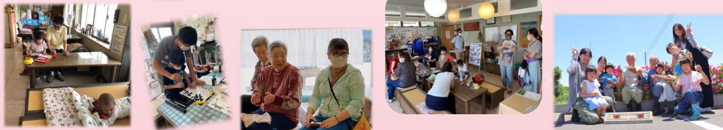
笑顔を力に変えて

2022年も、多くの方々に温かく支えていただき、活動を続ける事ができました。感謝の気持ちでいっぱいです。来年も、皆さんと一緒に一歩ずつしっかり歩んで参りたいと思っていますのでどうぞ宜しくお願い致します。