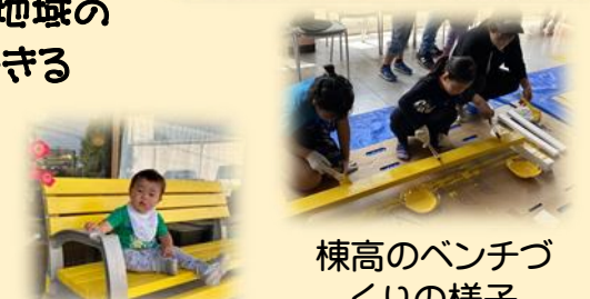
楯高のベンチづくりの様子

情報社会になった現代において、個人情報管理に敏感になるのは仕方ない事ですが、生活している地域において、住民同士お互いを知らなすぎる事もまたリスクとしては大きいように感じます。ひと昔前、井戸を共有していた長屋では、水くみ、洗濯をしながら住民同士が世間話に花を咲かせるいわゆる「井戸端会議」で情報交換をしながら困った時には助け合える関係が築けていたようです。井戸が本来の生活水の確保のためだけではなくつながりの場としての役割も担っていたのです。一人一台以上通信機器を持ち歩く現代、簡単に連絡が取れるようになったことで、会って話をする機会が減ったのではないのでしょうか? それで用は足りるかも知れませんが、会って話すからこそ感じられる安心感、は得難いかも知れません。「近隣大家族」は長屋の井戸のような場所。気軽に立ち寄ってもらいたいこの場所に「幸せのベンチ」を設置しました。